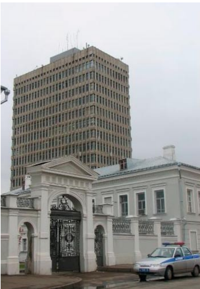
Das Gebäude der physikalischen Fakultät von unten...

Die Peter- und Paul Kathedrale, im 18. Jahrhundert zu Ehren des Besuchs Peters des Großen in Kasan errichtet, war lange Zeit das höchste Bauwerk in Kasan. Auch heute noch prägen die blau-weiß gemusterten Zwiebeltürme des für Rußland eigentlich so untypischen barocken Gotteshauses die Kasaner Innenstadt in der Ansicht von oben. Etwas höher in den Himmel ragen seit einem Jahr jedoch die acht Minarette der an historischer Stelle neu errichteten Kul-Scharif-Moschee im Kasaner Kreml. Am Beginn des 550 km langen Samaraer Stausees ist der Fluß mächtig angeschwollen und bedeckt nun auch den Friedhof der Eroberer Kasans unter Ivan dem Schrecklichen. Nur die pyramidenförmige Spitze eines zu ihren Ehren errichteten Tempels ragt noch aus den Fluten hervor. Jenseits des Wassers erstrecken sich endlose, graue Plattenbauwüsten.